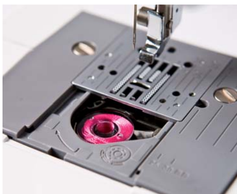
Snel verwisselbare spoel