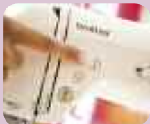
Handige centrale bediening

Bedieningsknoppen gebundeld op een handige locatie.