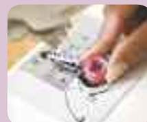
Snel verwisselbare spoel

Plaats eenvoudigweg een nieuwe spoel en u bent klaar om te gaan naaien.